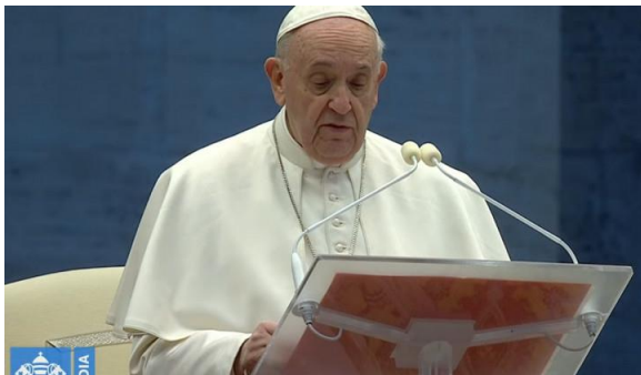
Papež Frančišek

Pred praznim trgom sv. Petra, ki v teh dneh verodostojno odraža praznino stanja po svetu, je Papež Frančišek v petek, 27. marca 2020 vodil molitev za konec pandemije in podelil blagoslov Urbi et Orbi, mestu in svetu, kar običajno stori le za božič in veliko noč.