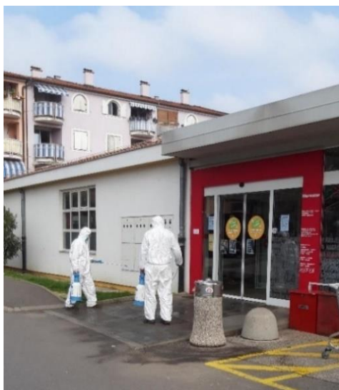
Razkuževanje v središču Ankarana