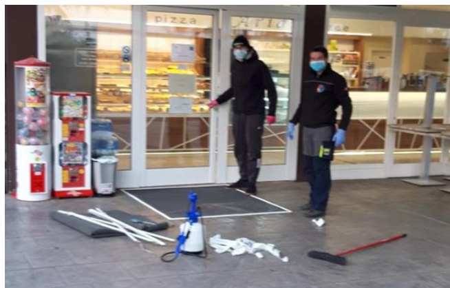
Terenski prostovoljci

Na terenu ima Krizni štab COVID-19 podporo mladih, srčnih prostovoljcev. Skrbijo za zaščito javnih površin, razdeljevanje zaščitne opreme trgovinam in lokalom z nujnimi živili, raznašanje letakov z obvestili in izvedbo drugih aktivnosti v času ustavljanja javnega življenja. Prostovoljci dnevno krožijo po kraju, preverjajo stanje javne infrastrukture in poročajo pristojnim službam. Ob kršitvah sodelujejo z Medobčinskim inšpektoratom in redarstvom Občine Piran in Občine Ankaran, ki nadzoruje izvajanje ukrepov in po potrebi opozarja kršitelje.