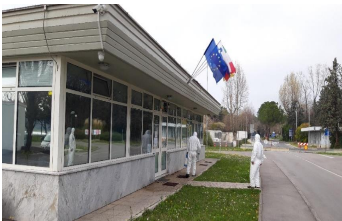
Razkuževanje na Lazaretu

20. in 21. marca 2020 je v bilo v občini Ankaran izvedeno razkuževanje javnih površin in urbane opreme (zabojniki za odpadke na ekoloških otokih) . Prednost so imele najbolj »kritične točke« za prenos virusa oz. okužbe, torej lokacije, kjer se zadržuje največ ljudi (lekarna, trgovina, banka, pošta, parkirišče, zdravstvene ambulante, vhod v OB Valdoltra, ulični sistem...).