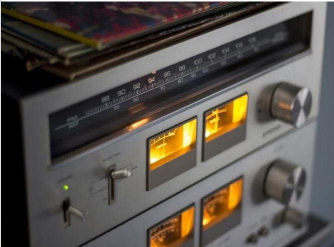
Prva radijska oddaja OŠV Ankaran.

Tudi ravnateljica je spregovorila o dnevu državnosti in doživljanju le-tega, ko je država šele nastajala.