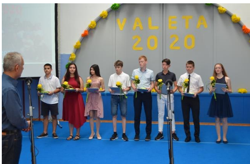
Najuspešnejšim je Občina Ankaran podelila priznanje za odličnost in praktične nagrade.

Verjetno učenci zaključnega razreda osem- ali devetletne osnovne šole še nikoli niso bili pred tako hudim izzivom kot letošnja generacija 2011–2020 . V napetem obdobju zaključevanja ocen po komaj končanem pouku na daljavo jim je namreč preostalo izjemno malo časa, ki so ga lahko namenili še zadnjemu dejanju. V običajnih razmerah bi to predstavljalo veliko časa, posvečenega načrtovanju in izvedbi ustvarjalnega podviga, ki se ga