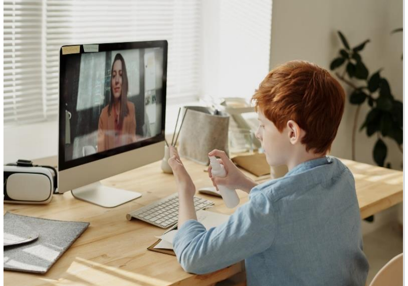
Mnogim se je šolsko delo zdelo ustvarjalnejše, naloge pa zanimivejše.

Kako so učenke in učenci doživljali pouk na daljavo? Medtem ko se je nekaterim zdel zahtevnejši od običajnega pouka, se je mnogim šolsko delo zdelo ustvarjalnejše, naloge, ki so jih pošiljali učitelji, pa zanimive. Všeč jim je bilo, da so si doma lahko delo organizirali po svoje, nekaterim pa tudi to, da so zjutraj lahko malo dlje spali. Učenci so najbolj pogrešali stik s sošolci oz. vrstniki ter sodelovanje in razlago učiteljev.