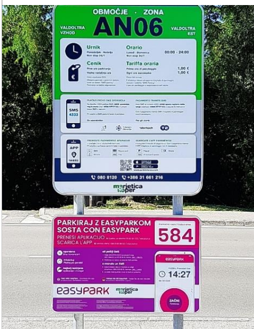
Plačilo parkirnine je omogočeno prek aplikacije Easy park.

Ankaran se že leta sooča z izzivom mirujočega prometa, ki vrhunec doseže v poletnih mesecih. Letos je ta izziv dodatno otežila še epidemija koronavirusne bolezni, ki je pospešila prizadevanje občine za ureditev mirujočega prometa v poletnih mesecih. Lokalna skupnost s ciljem omejevanja pritiska obiskovalcev na Ankaran in vzpostavitve reda na področju parkiranja pospešeno uvaja nekatere mehanizme. Tako so bila javna parkirišča v občini urejena ter opremljena z ustrežno prometno signalizacijo, ki omogoča uvajanje plačljivega režima parkiranja.