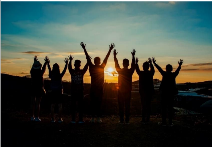
Mladi so v času izolacije morali hitreje odrasti.

Tudi na letošnjo rano pomlad se narava ni pustila motiti. Travniki so bogato zacveteli, še več, ko je svet zaradi koronavirusa obstal, se nam je zazdelo, da si je narava oddahnila. Zaradi manjšega onesnaževanja, redkejšega prometa in človekove nenadne ponižnosti, ki sledi strahu pred negotovostjo, je zasijala v vsej svoji lepoti. V nekem trenutku smo spoznali, da je potreba po sobivanju zgolj enostranska in da ljudje nismo nepogrešljivi del narave. In če je bilo s psihološkega vidika za starejšo generacijo to obdobje celo nekoliko pomirjujoče, saj se je korak upočasnil in smo ljudje znova bolje slišali drug drugega, je epidemija v mlade vnesla dodaten nemir, jezo, včasih tudi željo po uporabi, ko so bili na silo iztrgani iz svojih vrstniških krogov, razreda, ulice, športa, prvih ljubezni.