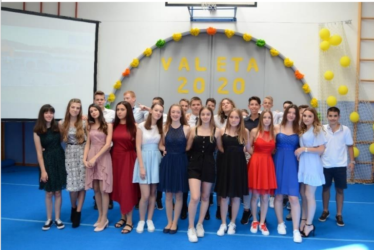
12. junija je imela valeta generacija devetošolcev 2011/12.

Šola so predvsem učenci in njihova ustvarjalnost, prijateljske vezi, vedoželjnost in mladostno navdušenje ter razposajenost. Vse to se običajno poveže, pokaže in občuduje na valeti, ki predstavlja nam, ki delamo v šoli, nekakšen praznik, ki ga vsako leto praznujemo, ker se veselimo rasti in uspehov naših učencev.