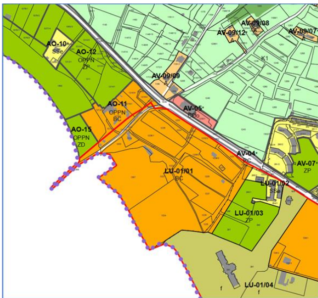
Slika 3 OPN Občine Ankaran - območje OA-15 (nepremičnina s parc. št. 1358 k.o. Oltra) in LU-01/01 (območje športno rekreacijskega parka in mandrača)

Dne 27. 10. 2020 je bil sprejet občinski prostorski načrt Občine Ankaran (OPN), ki na območju predmetne nepremičnine in vodnega zemljišča določa enoto urejanja prostora OA-15 z namensko rabo druge urejene zelene površine (ZD) , kar omogoča ureditev zelenega pasu z zaščitno funkcijo. Športne dejavnosti, ki ne sodijo na območje zelenih površin (vodnega območja), se po OPN umestijo v neposredni bližini nekoliko proti vzhodu, na sosednjo parcelo št. 1357, k.o. Oltra, (in druge), kjer leži območje športno rekreacijskega parka Sv. Katarina z urejenim igriščem za nogomet, novimi igrišči za odbojko na mivki, mandračem (lokalno pristanišče) ter drugo opremo za potrebe vodnih športov. Območje ŠRP Sv. Katarina poleg občinskega prostorskega načrta (OPN) ureja tudi državni prostorski načrt (DPN).