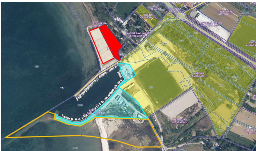
Slika 4 prikazuje:

Občina Ankaran je z Republiko Slovenijo začela uspešno in tvorno sodelovanje v smeri izvedbe občinskih in državnih nalog in projektov. Na podlagi tega sodelovanja je Občina Ankaran od Republike Slovenije v letu 2020 kupila in pridobila lastninsko pravico na nepremičninah s parc. št. 920/3 in 920/4, obe k.o. Ankaran, kar ji bo omogočilo nadaljnje urejanje in izgradnjo še dodatnih igrišč za odbojko na mivki, spremljajočih objektov ter druge javne infrastrukture za izvajanje športnih dejavnosti ter ureditev krajevnega pristanišča. Vrednost investicije v nakup dodatnih zemljišč na območju Sv. Katarine je znašala 946.213 EUR.