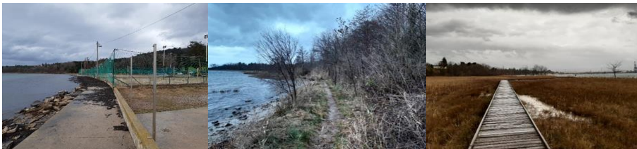
Slika 1: Obstoječe stanje pešpoti

Območje nepremičnine s parc. št. 1358, k.o. Oltra, je v pretežni meri nepozidano. Izjema so v preteklosti nezakonito postavljeni objekti in športna infrastruktura na površini, ki je od morja razmejena z dotrajanim, mestoma poškodovanim betonskim zidom in manjšim skalometom. Proti zahodu območje preide v obrežno morsko močvirnato površino. Osrednje območje je poraščeno do te mere, da je lokacija z izjemo obalnega pasu neprehodna. Na skrajnem zahodu se nahaja iztočni del regulirane struge hudournika Ankaran, na severozahodnem delu pa se pešpot od obstoječega mostovža nadaljuje do servisne poti, ki povezuje obalo s Spominskim parkom. Pot je dotrajana in potrebna obnove.