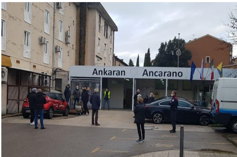
Izvedba množičnega testiranja v Ankaranu.

Testiranje je BREZPLAČNO. Rezultati testiranja bodo znani v približno 15 minutah. Predhodna najava ni potrebna.