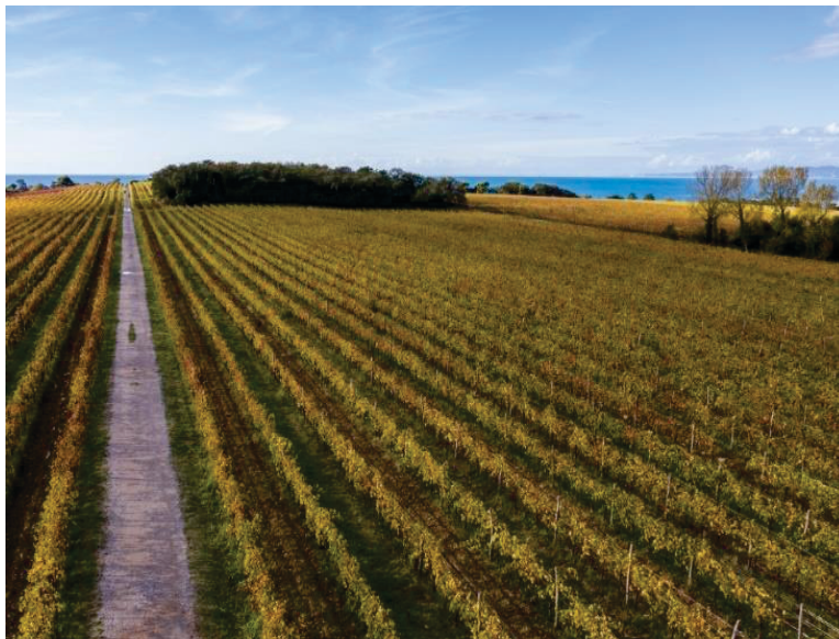
Med vinogradi se lahko sprehodimo do klifa, ki je osrčje Krajinskega parka Debeli rtič.

zanimivosti, ki nas spominjajo in opominjajo na bisere, ki jih je ustvarila narava. Občudujemo lahko tudi stavbno dediščino in spomenike druge svetovne vojne. Med odkrivanjem naravnih lepot lahko veliko naredimo tudi za svoje telo in splošno dobro počutje. V parku so tri različno dolge rekreativne poti, ki se razlikujejo tudi po težavnosti. Na spletni strani www.VisitAnkaran.si so na voljo zemljevidi poti in posnetki vaj za moč, ki jih je mogoče opraviti med hojo, s pomočjo računalnika pa je mogoče izračunati tudi porabo energije.