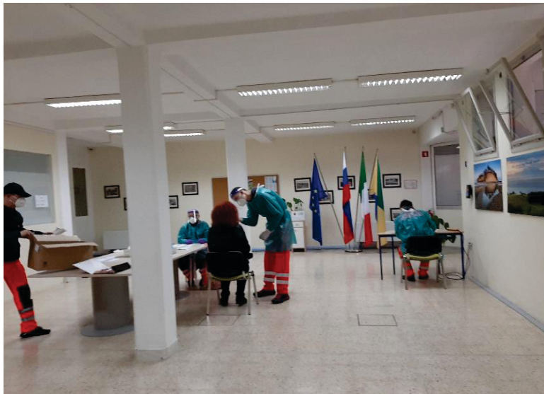
Z rednimi testiranjmi omejimo prenos okužb.

migracijami med občinami, še toliko bolj pomembno. S hitrimi antigenskimi testiranjmi izločamo okužene občane ter preprečujemo širjenje virusa, predvsem pa vnos slednjega v šolo in vrtca, ki delujeta v Ankaranu. Hkrati tako pomagamo prebivalcem, ki za opravljanje svojih dejavnosti potrebujejo negativne teste na COVID 19, saj jim testiranje ni treba opravljati v drugih občinah.