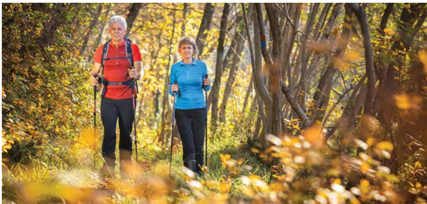
Med potmi, ki so bile zbrane v registru, je 28 pohodnih, 20 kolesarskih, 16 učnih, tri konjeniške poti in tri naravna plezališča. / Didascalia sotto la foto: Tra i sentieri presenti nel registro, 28 sono escursionistici, 20 ciclabili, 16 didattici, tre ippovie e tre sono vie naturali di arrampicata.

La prima guida ciclistica ed escursionistica dell'Istria slovena, Godiamoci la campagna , pubblicata nel 2013, viene riproposta. Il progetto è stato avviato a settembre 2018 e si è concluso a settembre di quest'anno. Gli obiettivi principali erano la sistemazione della segnaletica sui sentieri nei comuni istriani e la creazione delle basi per poterli collegare con altre aree, nonché la riduzione della pressione sulla fascia costiera reindirizzando i visitatori verso l'entroterra.