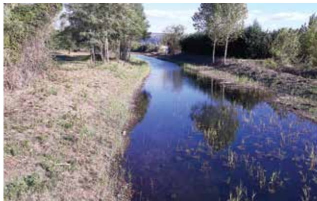
Košnja je pokazala, da je v naravi še vedno odvrženo veliko odpadkov. / La falciatura ha evidenziato che molti rifiuti vengono ancora scaricati abusivamente nell'ambiente naturale.

Oktobra je Direkcija RS za vode (DRSV) na območju ankaranske Bonifike z namenom vzpostavitve pretočnosti strug pred jesenskim deževjem izvedla čiščenje zarasti iz struge Ankaranskega obrobnega kanala (AOK). Dela so se izvajala na vodotoku v skupni dolžini 2500 m. Na tem območju je bila zaključena tudi košnja glavnih odvodnih kanalov depresijskega območja bertoškega in ankaranskega dela Bonifike (košnja desne brežine Rižane od Luke Koper do gostišča na Bivju v dolžini 3000 m).