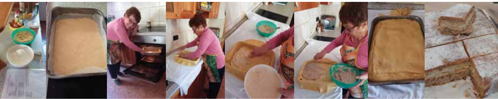
Ražmanova je 1, 2, 3 sestavila potratno potico. / La signora Ražman ha preparato la potica con strati di ripieno a base di noci e ricotta in un batter d'occhio.