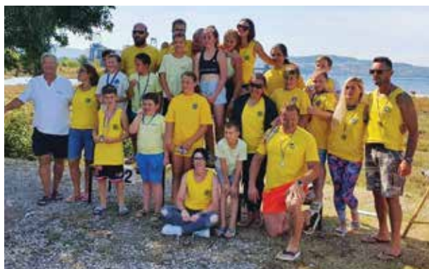
KKK Adria Ankarano je uspešno organiziral že 28. Mednarodno regato Adria. / Il Kayak canoa club Adria Ancarano ha organizzato con successo la 28a Edizione della regata internazionale Adria.

L'11 settembre, a Santa Caterina, il Kayak canoa club Adria Ancarano ha organizzato la 28a edizione della Regata internazionale kayak canoa Adria, a cui hanno partecipato cinque club dalla Slovenia, tre dall'Ungheria e uno dalla Spagna. Più di 150 gareggianti si sono misurati in 33 competizioni, su un percorso di 200 m e 500 m di lunghezza. Grazie al bel tempo soleggiato la regata si è svolta regolarmente e senza intoppi. Vorremmo ringraziare lo sponsor principale, il Comune di Ancarano, per l'organizzazione di successo della regata.