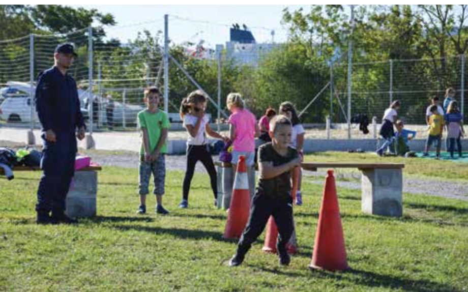
Nasmejani otroci so se spoprijemali z različnimi nalogami in izzivi. / I bambini sorridenti hanno affrontato vari compiti e sfide.