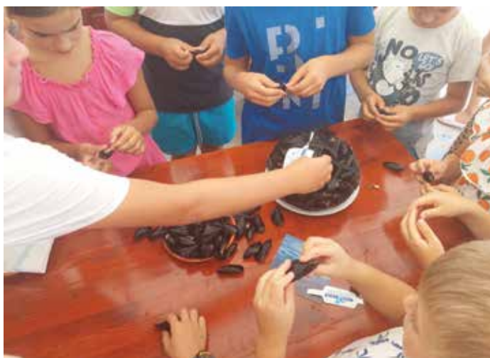
I bambini hanno pulito le cozze. / Otroci so čistili klapavice.

Prijazna posadka plovila je udeležence popeljala do školjčičišča v Sečovljah, kjer jim je predstavila najpomembnejše značilnosti teh mehkužcev, pritrjenih na gojitvene vrvi in mrežice, ki so obešene na plavajočih plovcih in urejene v gojitvena polja. Klapavice se prehranjujejo s planktonom, ki ga prefiltrirajo iz morske vode, torej popolnoma naravno, brez dodatne industrijsko pridelane hrane. Školjke rastejo počasi, in sicer od 12 do 18 mesecev. Njihovo meso je zelo okusno in hranljivo, saj poleg 82 % vode vsebuje tudi 10 % beljakovin, 1 % maščob, ogljikove hidrate, jod in rudninske snovi.