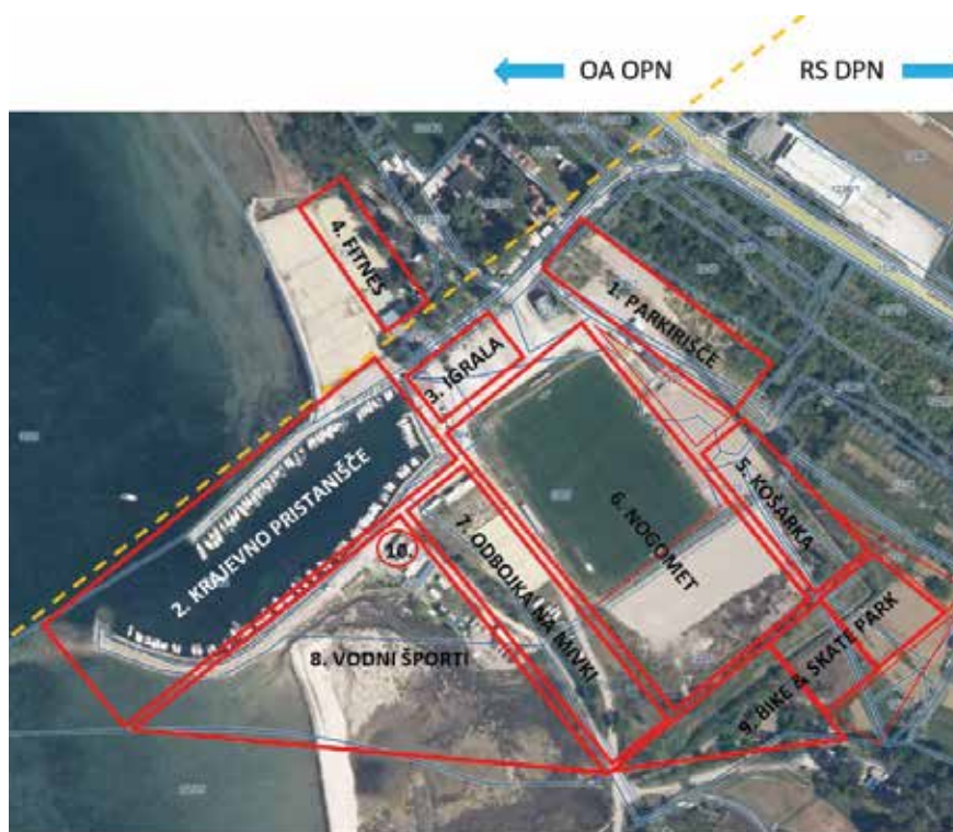
Shematski prikaz predloga začasne umestitve objektov športne in spremljajoče infrastrukture. / Schema del progetto di sistemazione temporanea degli impianti sportivi e delle infrastrutture di accompagnamento.

La zona di Santa Caterina è da sempre una zona dedicata allo sport ad Ancarano, dove da decenni vengono svolte molte attività sportive da varie associazioni. Allo stesso tempo, per la sua ubicazione, l'area di Santa Caterina rappresenta una zona di contatto tra il Piano regolatore nazionale (PRN) e il Piano regolatore comunale (PRC). Sebbene entrambi in quest'area prevedano contenuti sportivi, i rapporti di proprietà irrisolti hanno contribuito al fatto che l'area non sia ancora stata integralmente regolamentata. Per tale motivo il Comune di Ancarano presentato un'iniziativa al Governo della Repubblica di Slovenia per il consenso all'uso temporaneo dell'area.