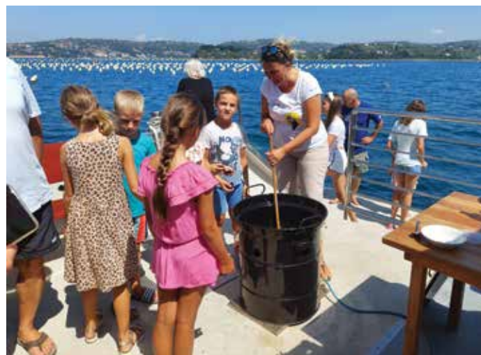
Assieme abbiamo preparato le cozze alla busara. / Skupaj smo pripravili klapavice »na buzaro«.