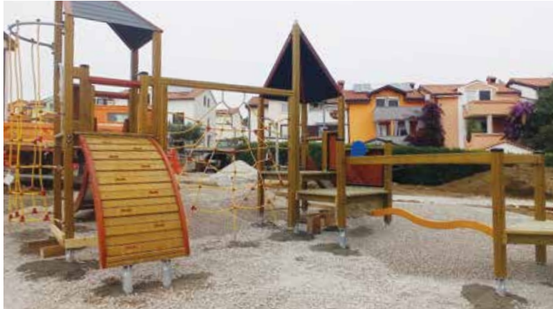
Nova igrala bodo navdušila mlajše in starejše otroke. / Il nuovo parco giochi farà contenti sia i bambini piccoli che quelli più grandi.

Občina Ankarano, Oddelek za razvoj in investicije / Comune di Ancarano, Dipartimento sviluppo e investimenti