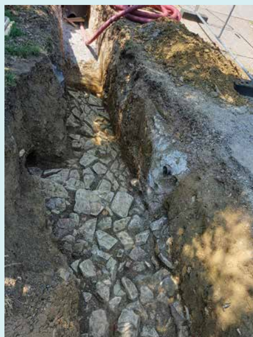
Arheološke najdbe datirajo v obdobje antičnega Rima. / I reperti archeologici risalgono al periodo dell'antica Roma.

A causa del regime di protezione dei beni culturali in vigore nell'area della Baia di San Bartolomeo e del Paesaggio culturale di Punta Grossa, prima dell'inizio dei lavori di ricostruzione sono stati effettuati degli scavi archeologici, che hanno rivelato resti di una struttura in pietra a secco e uno strato di rovine con una grande quantità di materiale da costruzione antico e varie ceramiche.