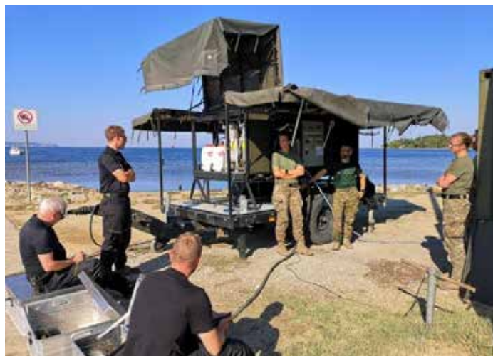
Prečiščevanje vode na Sv. Katarini. / Trattamento dell'acqua a Santa Caterina.

Osrednja vaja sil Slovenske vojske v letu 2021 je namenjena krepitvi pripravljenosti Slovenske vojske za sodelovanje v sistemu varstva pred naravnimi in drugimi nesrečami v Republiki Sloveniji ter povezovanju na področju zagotavljanja varnosti z državami članicami EU, pridruženimi partnericami, zmožljivostmi Uprave Republike Slovenije za zaščito in reševanje ter pomembnimi podjetji na področju mobilnosti in logistike (Luka Koper, DARS, Slovenske železnice).