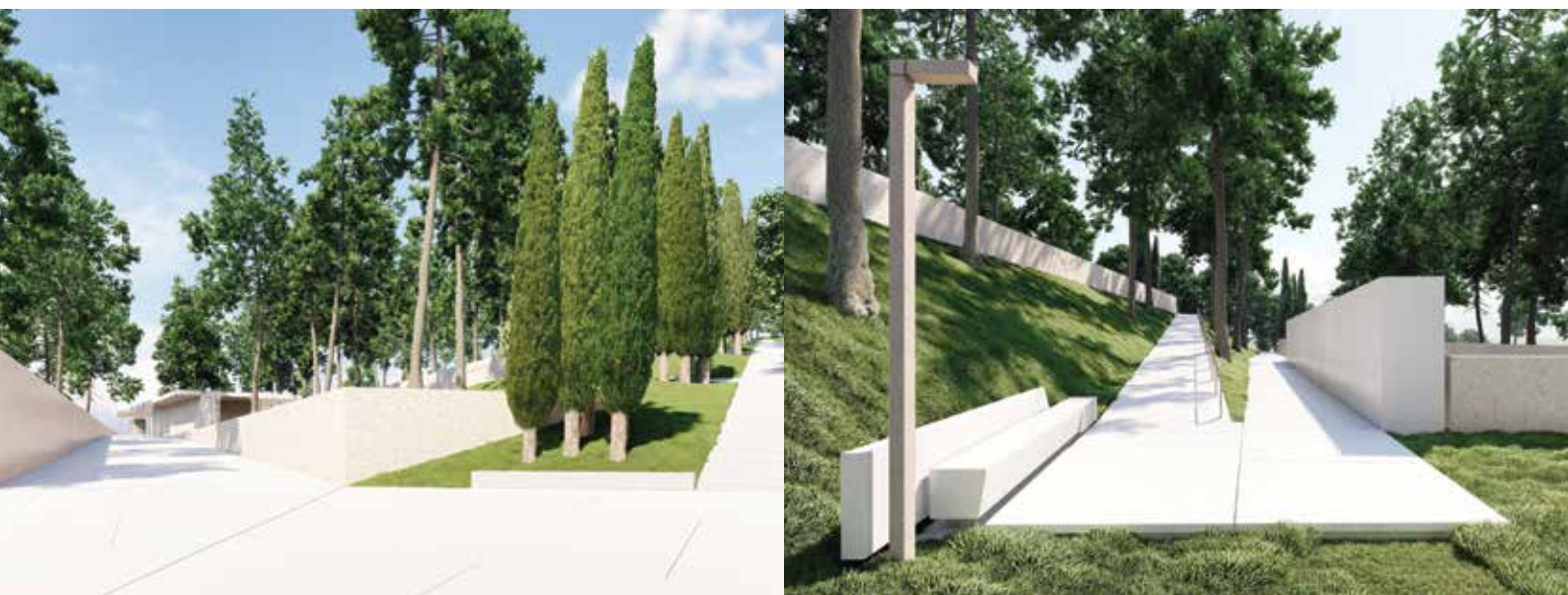
Vstopni trg in procesna pot. / Piazzale d'accesso e percorso procedurale.

Dopo più di un decennio finalmente inizieranno i lavori di costruzione del cimitero di Ankarano. All'inizio di ottobre, il comune di Ankarano ha ottenuto il permesso edile per la costruzione del nuovo cimitero.