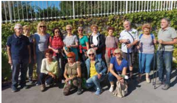
Seniorje družijo veselje do nordijske hoje in dobre družbe. / I senior condividono il piacere della camminata nordica e della buona compagnia.

Seniorji, ŠD Ankarana / I senior, Associazione sportiva di Ancarano