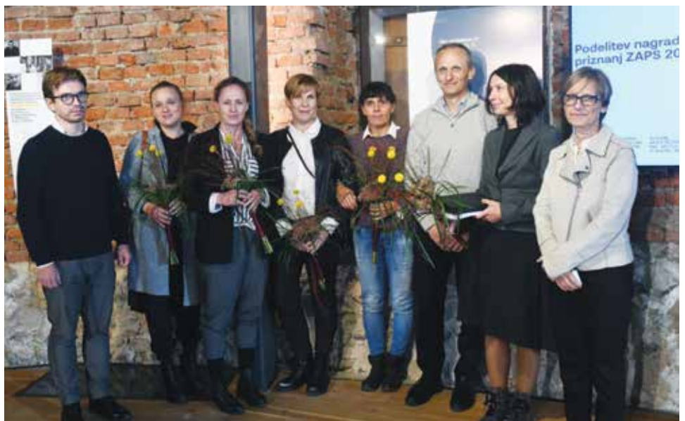
OPN Občine Ankaran so zasnovali v družbi LOCUS prostorske informacijske rešitve d. o. o. / Conferito il riconoscimento »Matita d'Oro« per la pianificazione territoriale per il 2021 al PRC del Comune di Ancarano.

Alla cerimonia di premiazione, la Commissione d'oro per il lavoro eccellente nel campo della pianificazione del territorio, composta da rinomati esperti nel campo dell'architettura e dell'architettura paesaggistica, nella propria motivazione ha spiegato: »La qualità del progetto premiato si riflette nell'atto territoriale, che sulla base di una strategia chiaramente definita del Comune di Ancarano fornisce un ambiente di vita di qualità alle generazioni attuali e future, antepone gli interessi comuni di tutte le parti interessate allo spazio privato e determina la strategia di sviluppo territoriale e pone le condizioni per l'implementazione territoriale. Le