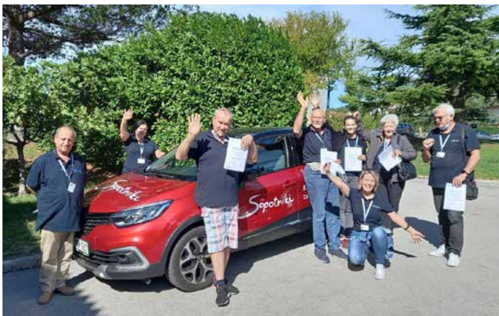
Prostovoljci so zelo razveselili priznanj župana. / Ai volontari ha fatto piacere ricevere il riconoscimento del sindaco.