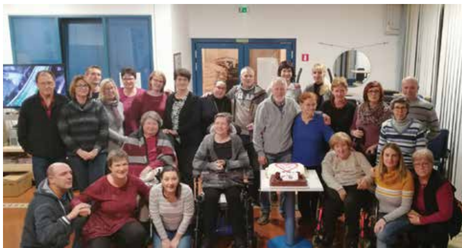
V Ankarano potekajo rehabilitacijski programi, ki so namenjeni tudi bolnikom z multiplo sklerozo. / Ad Ancarano vengono effettuati anche programmi riabilitativi, rivolti a pazienti con sclerosi multipla.

La sclerosi multipla è una malattia che colpisce principalmente i giovani in età compresa tra i 20 e i 40 anni. La sclerosi multipla è una malattia autoimmune infiammatoria cronica più comune del sistema nervoso centrale e causa disabilità nei giovani adulti. La malattia colpisce circa due volte più frequentemente le donne che gli uomini, la causa, invece, è sconosciuta. La sclerosi multipla non è una malattia ereditaria, ma la parentela di primo grado con malati di sclerosi multipla aumenta fino a dieci volte il rischio di ammalarsene.