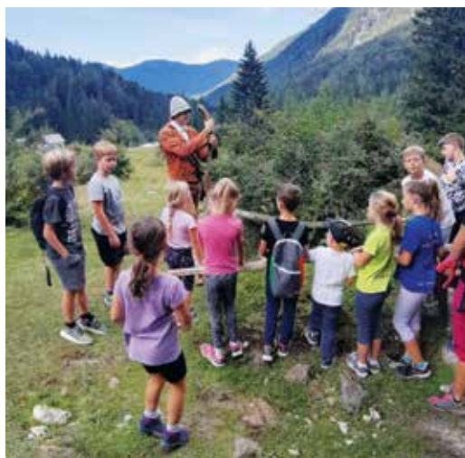
V Kekčevi deželi so uživali tako otroci kot odrasli. / La visita al villaggio di Kekec, un'esperienza indimenticabile per adulti e bambini.

Sončen dan, preživet v dobri družbi in neokrnjeni naravi, je vsekar lep izkušnja tako za otroke kot tudi za odrasle.