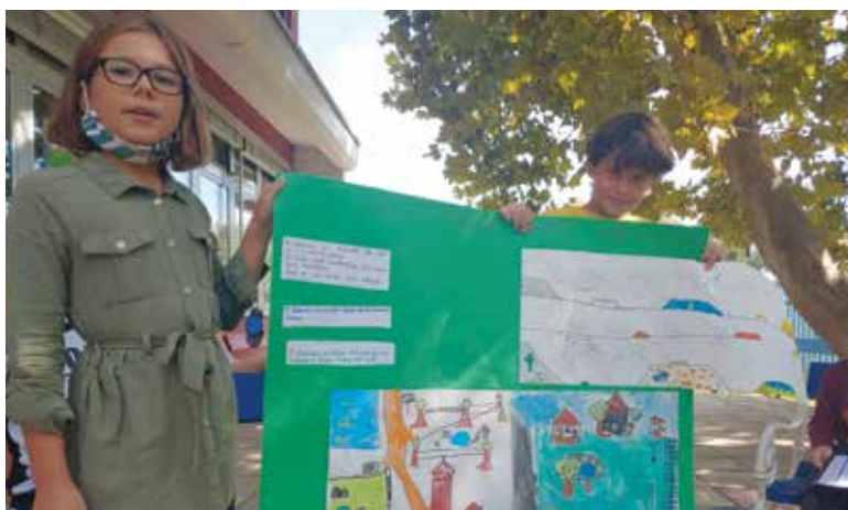
Učenci in učenke OŠV se aktivno vključujejo v projekte trajne mobilnosti. / Gli alunni della SEA sono coinvolti attivamente nei progetti di mobilità sostenibile.

Občina je pridobila sredstva za izvajanje aktivnosti trajnostne mobilnosti celo leto (npr. brezplačni poletni avtobus). Najbolj intenzivno so se aktivnosti izvajale med Evropskim tednom mobilnosti , ki je pod sloganom » Živi zdravo. Potuj trajnostno. « potekal med 16. in 22. septembra.