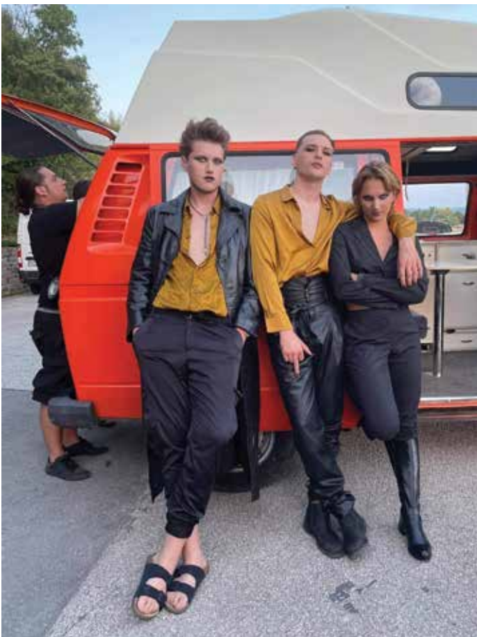
Kljub mladosti je v svoji karieri posnel že veliko projektov, na sliki utrinek iz snemanja. / Nonostante la sua giovane età, ha intrapreso la regia di molti progetti nella sua carriera, nella foto uno un'immagine durante le riprese.

Ideja je sicer bila moja, a vsa situacija je nastala zaradi družbe in skupnih ambicij. Res je, da sem za ta prvi film sam v dveh mesecih napisal scenarij, režiral, snemal – vse. Je zelo amatersko naraven, ampak to je bila prva izkušnja s filmom – star sem bil 13 let. Snemali smo novembra v ledeno mrzli vodi malo naprej od plaže Študent in 5. maja naslednje leto smo za premiero razprodali kinodvorano v Tušu. Sicer mi je pa že kot otroku delala domišljija: navdušen sem bil nad filmsko tehnologijo in zelo všeč mi je filmska glasba ... Film združuje vse, kar mi je všeč.