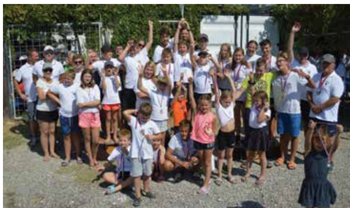
Kajakaši KKK Orka so letos stali na stopničkah kar 267-krat. / Quest'anno i kayakisti del Kayak canoa club Orka sono saliti sul podio 267 volte.

KKK Orka in KKK Adria Ankarano / Kayak canoa club Orka e Adria Ancarano