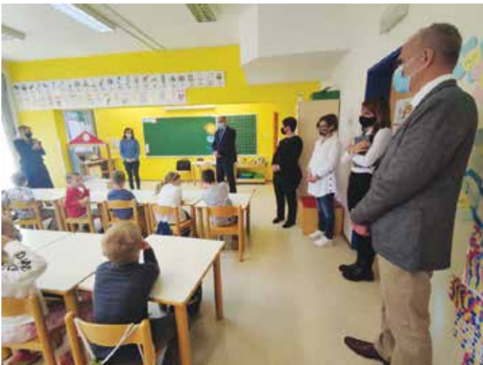
Državni sekretar je pozdravil tudi šolarje. / Il segretario di stato ha salutato anche gli alunni.