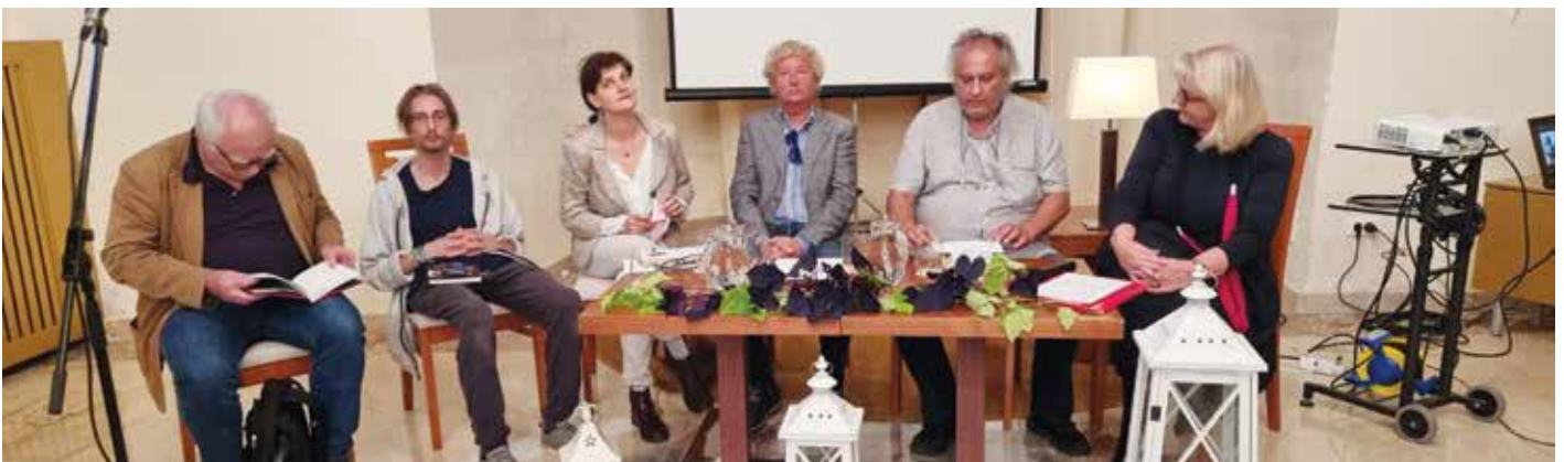
Na 4. Večeru jadranske poezije so se pesniki poklonili preminulim umetnikom. / Alla quarta edizione della Serata della poesia adriatica i poeti hanno reso omaggio agli artisti defunti.

L'evento è stato reso possibile da Biblioteca centrale Srečko Vilhar di Capodistria, Biblioteca di Ankarano, Associazione degli scrittori sloveni, Associazione culturale e artistica Faral e Fondo pubblico per le attività amatoriali, e cofinanziato dal Comune di Ankarano e dal Fondo pubblico della Repubblica di Slovenia per le attività culturali.