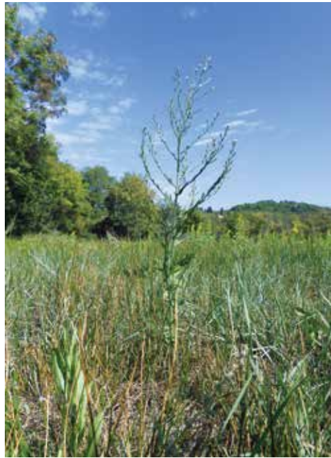
Luskasta nebina je invazivna tujerodna vrsta. / L'astro autunnale è una specie alloctona invasiva. (Foto: Režijski obrat, sodelavci KPDR / Azienda servizi comunali, collaboratori del Parco naturale di Punta Grossa)

V letošnjem letu smo začeli z natančnejšim spremljanjem stanja invazivnih tujerodnih rastlin na slanem travniku, ki je pomemben in redek habitatni tip slane travnišča in spada v omrežje območij Natura 2000. Invazivne tujerodne vrste so problematične, saj se lahko pretirano razširijo in izpodrinejo avtohtone. Na slanem travniku smo zasledili luskasto nebino, navadni bodič in navadno amorfo. Da bi omejili njihovo širjenje, smo v septembru izvedli odstranjevanje luskaste nebine in navadnega bodiča. Stanje bomo spremljali še naprej in odstranjevanje ponovili vsako leto, dokler se bodo rastline še pojavljale.