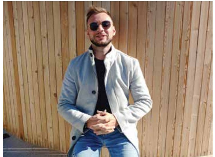
Kar mu ostane prostega časa, ga preživi s prijatelji. / Il tempo libero lo passa con gli amici.