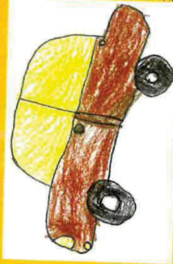
Risbe so prispeli otroci vrtca Ankaran.